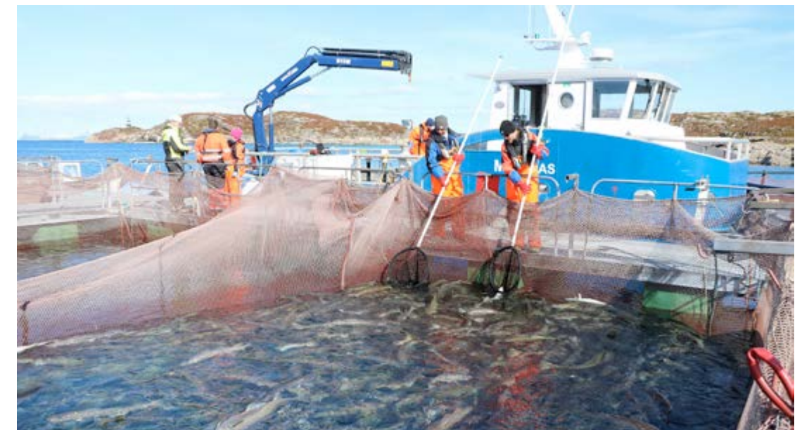
HÅVER: Her håves torsk opp til merking.

vanlig lodde. Føringperioden er på 24 uker, etter dette skal all fisken slaktes, og status gjøres opp.